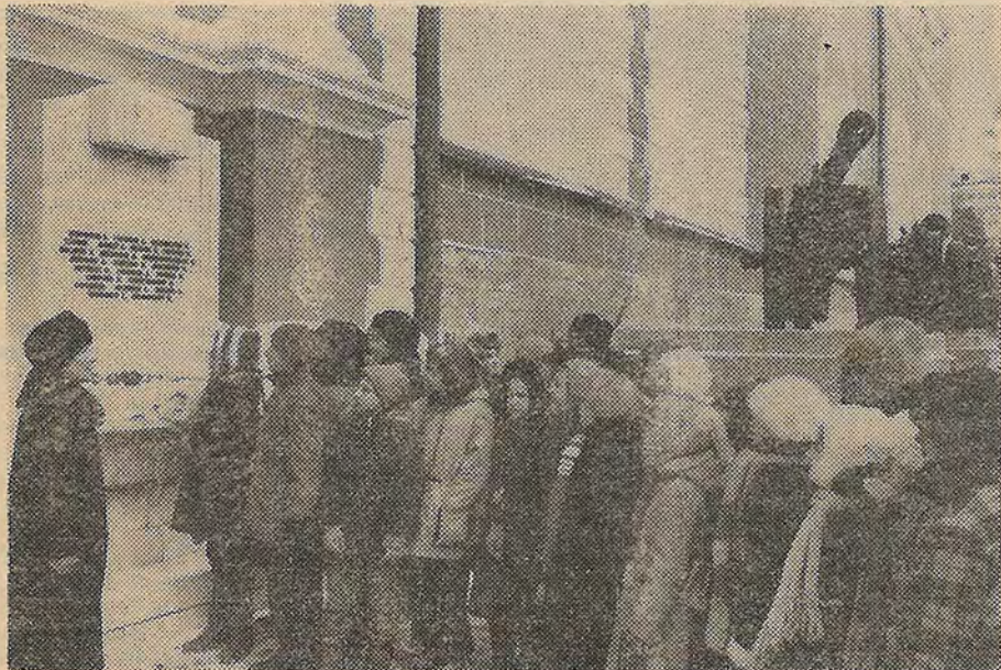
На снимках: баррикады на Арбатской площади 1917 года; на этом месте в Кремле утром 8 октября 1917 года юнкера, захватившие Кремль, расстреляли находившихся там революционных солдат.

Будто листаешь книгу истории, книгу памяти, проходя по ее улицам, мимо домов, которые сегодня сами стали реликвиями революции.